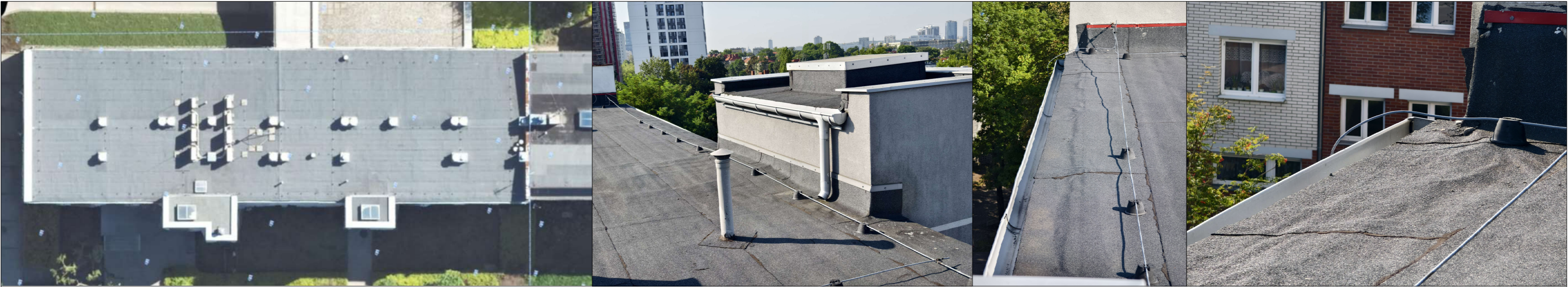
WIDOK DACHU ORTOFOTOMAPA